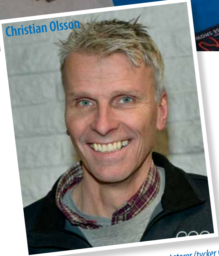
En av Sveriges mest folkära sportkommentatorer (tycker vi)